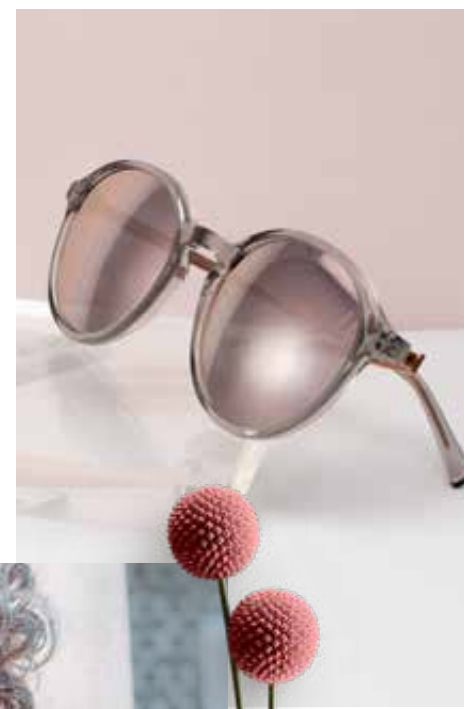
4792-15 | 89€