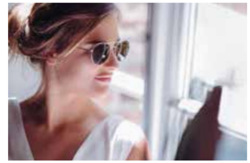
4790-01 | 98€