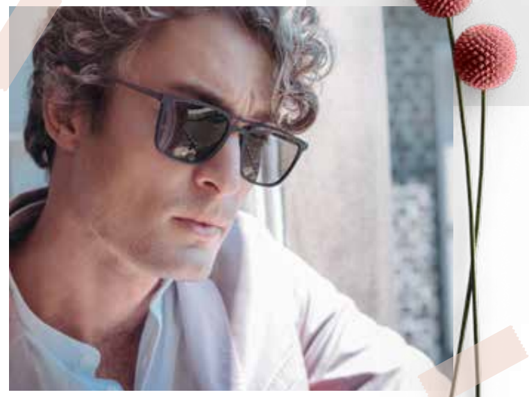
4794-04 | 89€