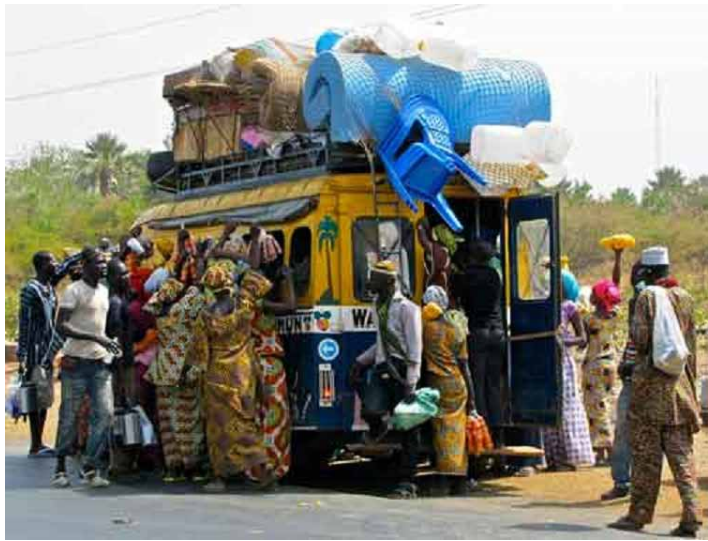
Überfüllte Busse machen Abstand halten unmöglich