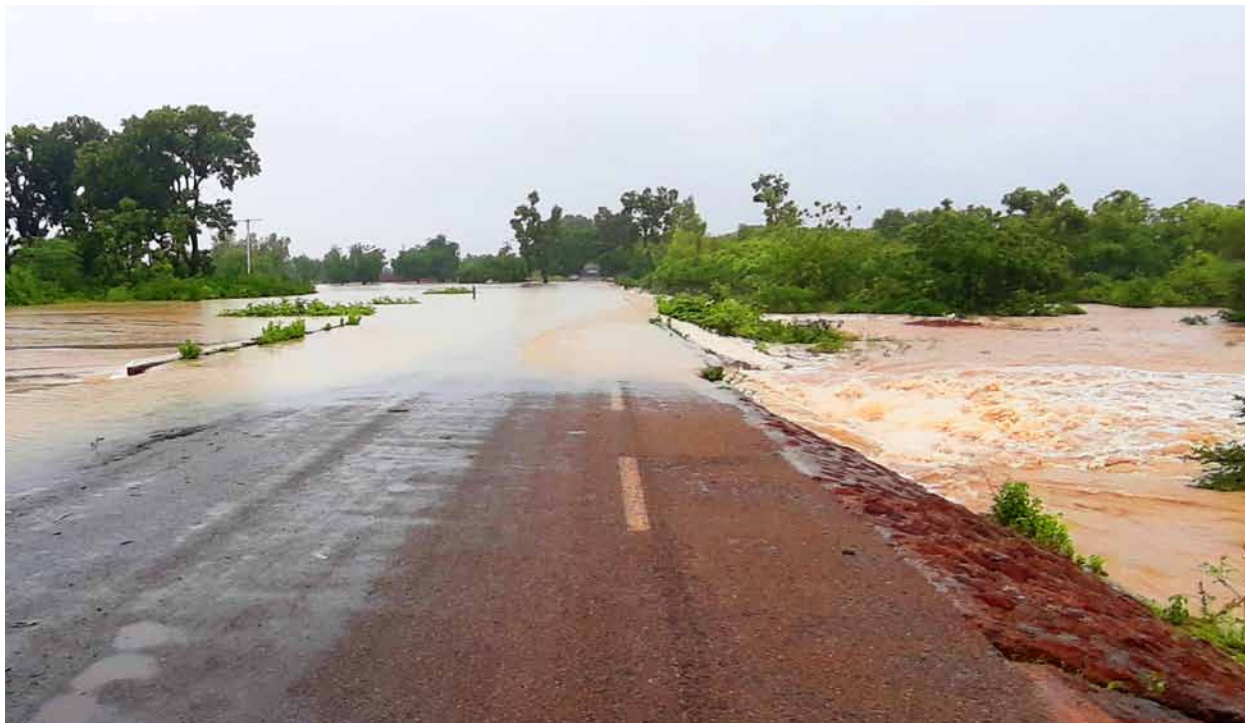
Schwere Überschwemmungen im September