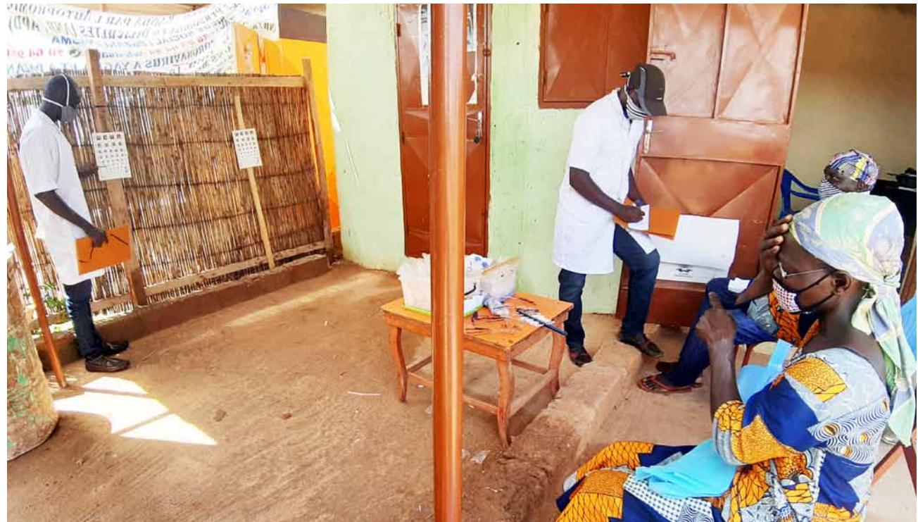
Sehtests mit Masken bei der EinDollarBrille